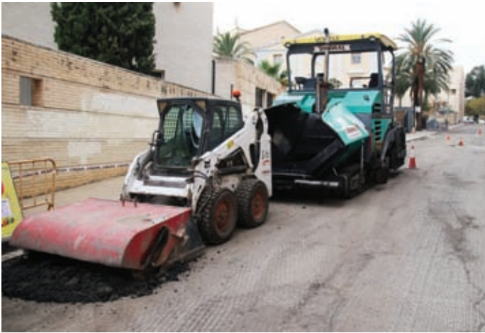
Les obres es fan també en altres barris