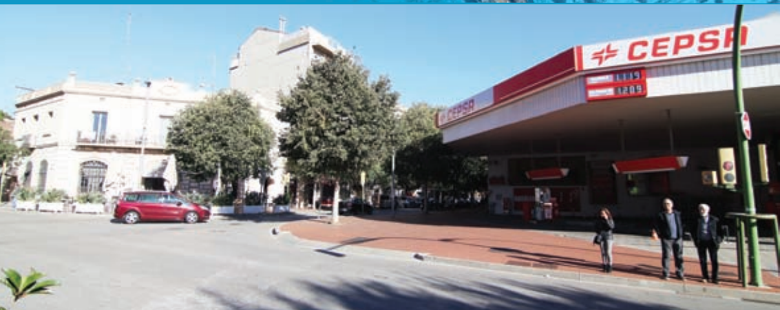
Les places entre carrers, espais de convivència a l'Eixample