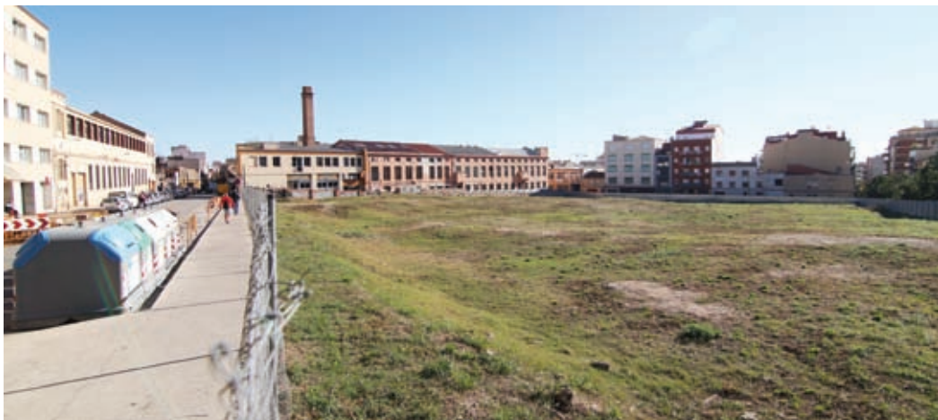
El solar d'El Corte Inglés, en l'actualitat