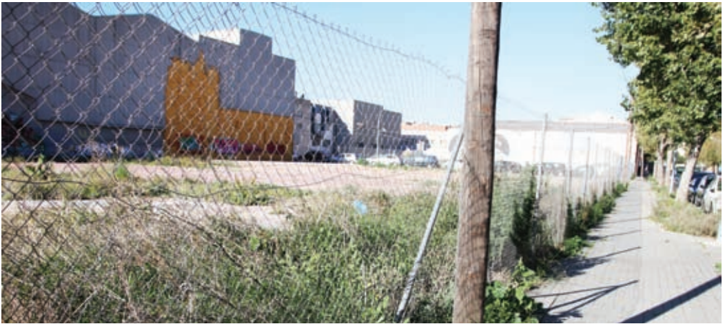
A la part baixa de Barceló s'hi ha d'alçar un gran edifici, el més alt de la ciutat