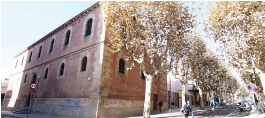
La Presó i el Cafè Nou, just a la meitat de La Riera