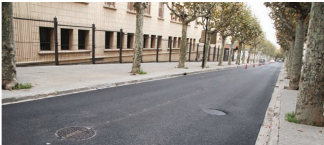
La part alta de La Riera, acabada de pavimentar, fa uns dies